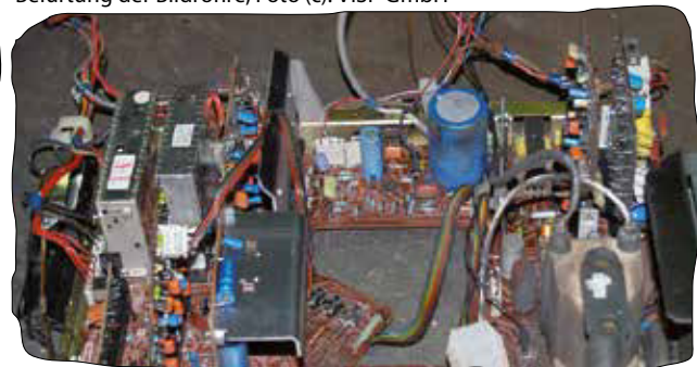
Leiterplatte mit Elektrolytkondensator (blauer Zylinder)