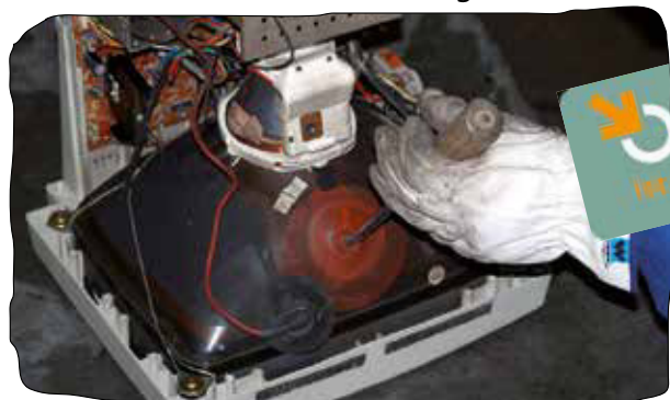
Belüftung der Bildröhre

Im Auftrag der NÖ BAWU Ges.m.b.H, der Verwertungs- und Logistikorganisation der NÖ Umweltverbände, sind mehrere Partnerbetriebe mit der fachgerechten Zerlegung und Verwertung beschäftigt.